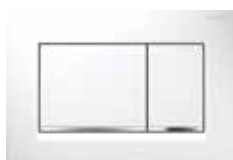
Geberit Sigma 30, wit/glanzend/wit