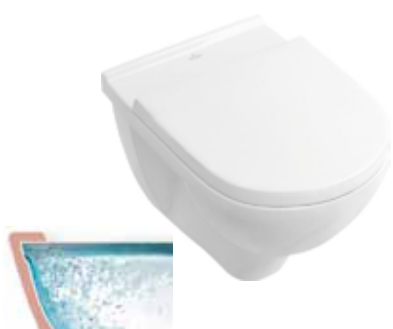
Villeroy & Boch Wandcloset O Novo directflush wit Pack incl. closetzitting softclose en quick release