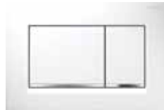
Geberit Sigma 30, wit/glanzend/wit