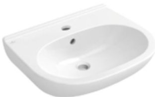
Villeroy & Boch wastafel O Novo wit 60 x 49 cm