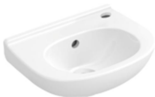
Villeroy & Boch fontein O Novo wit 36 x 27,5 cm