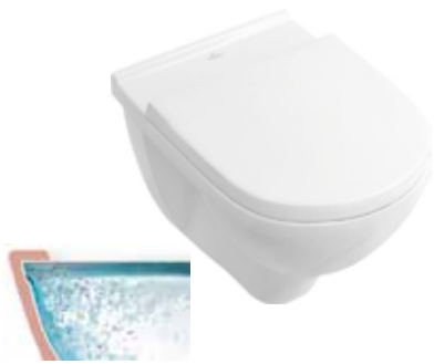
Villeroy & Boch Wandcloset O Novo directflush wit Pack incl. closetzitting softclose en quick release