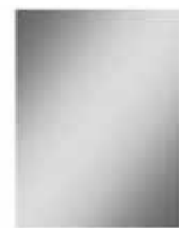
Spiegel 60 x 80 cm