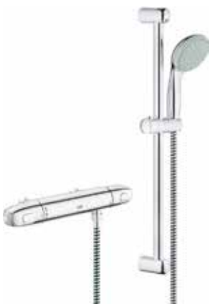
Grohe Grohtherm 1000 Thermostatische douchemengkraan