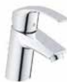
Grohe Eurosmart Wastafel- mengkraan S - Size